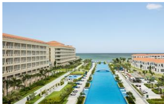
シェラトンブランド・ダナンリゾート