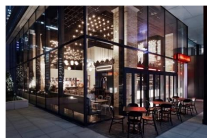
店舗外観 イメージ