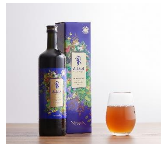
酵素ドリンクイメージ

銀座・京橋に位置する当ホテルは、都心にありながら皇居にも近く、リラックス気分を味わいながら周辺を散策したり、ショッピングを楽しんだり、ストレスなくファスティングが行えます。また、ホテル内フィットネスルームもご自由に利用でき、快適な環境の中で確実なファスティングが可能です。