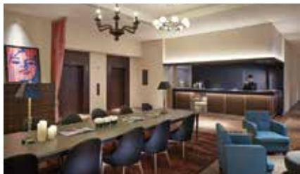
ホテル4階に位置するフロント。 会議室は同じフロアにございます。

Our conference rooms are located just beyond the hotel's front desk, pictured here.