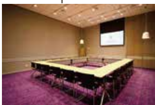
STUDIO 1 (52 m 2 ) Classroom 27 persons スクール 27名