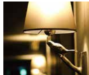
廊下には遊び心のあるデザインのランプ。 Playfully designed lamps grace the hallway.