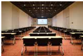
STUDIOS 2+3 (152 m 2 ) Classroom 108 persons スクール 108名 (STUDIO 2 (85 m 2 ) Classroom 63 persons スクール 63名)