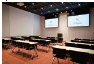
STUDIO 3 (67 m 2 ) Classroom 36 persons スクール 36名