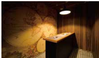
モダンな喫煙ルームを完備しています。 The smoking space is tastefully appointed.

Our conference rooms are located just beyond the hotel's front desk, pictured here.