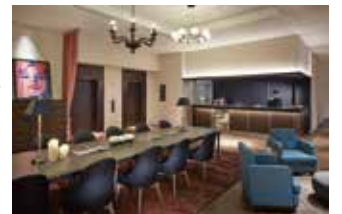
RECEPTION 受付カウンター (ホテルフロント)